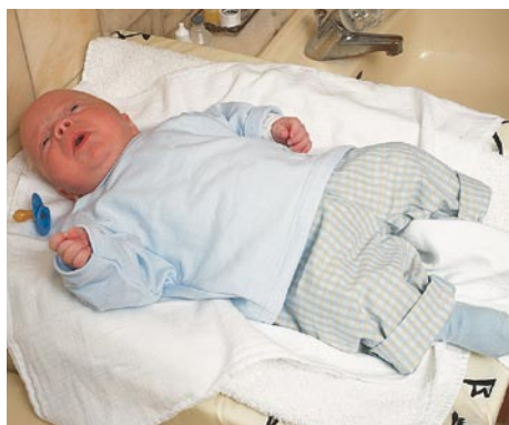
Er du grundig med stomiplejen vil dit barn normalt ikke føle sig besværet af stomiposen på maven, og er klar til at udforske den store verden.