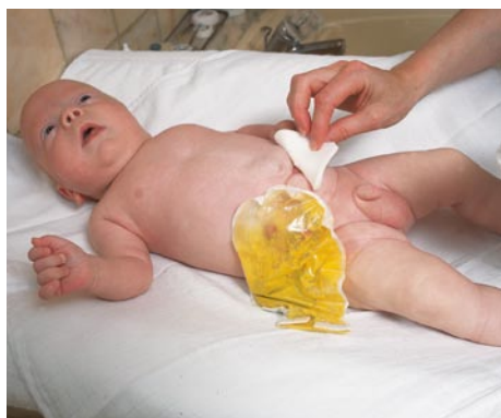
Efter tørring begynder aftagning af den brugte pose.

Misdannelsen kan sidde forskellige steder i tarmsystemet