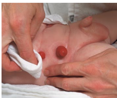
Huden tørres grundigt med en blød klud.