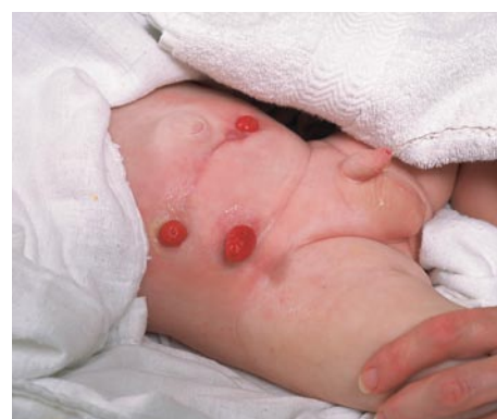
Når du har sikret dig, at huden er helt tør, kan den nye hudbeskyttelsesplade påsættes.