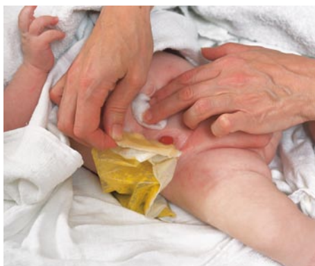
Et stykke fugtigt vat presses let mod huden, så huden stille og roligt fjerner sig fra hudbeskyttelsespladen.