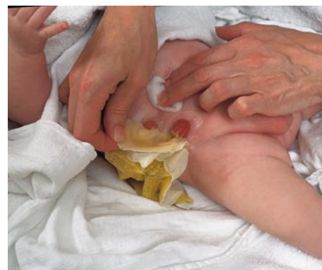
Det varme bad har smidiggjort den brugte hudbeskyttelsesplade, så den er let at fjerne fra huden.