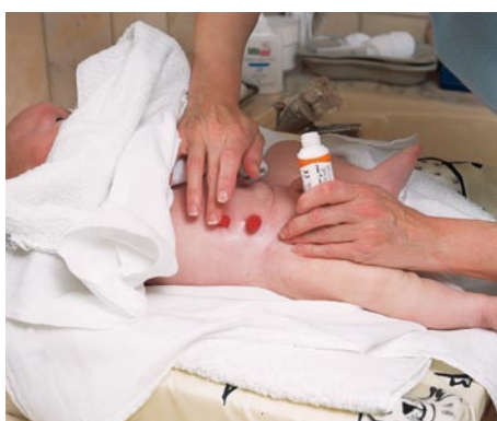
Er der områder med let rødmen, kan irriteringer forebygges med påsmøring af f.eks. Dansac Skin Creme.